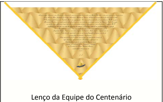
Lenço da Equipe do Centenário